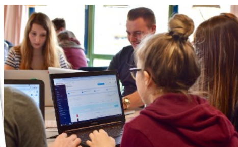
Wir bieten eine professionelle Arbeitsumgebung

Im Unterricht wird eine professionelle Umgebung zur Verfügung gestellt: