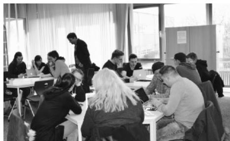
Schüleraktivität wird großgeschrieben: Unterricht im PLUS-Programm

Jahrgangsstufe nicht prüfungsrelevant. Für die Auszubildenden ergibt sich somit kein Nachteil hinsichtlich der Abschlussprüfung.